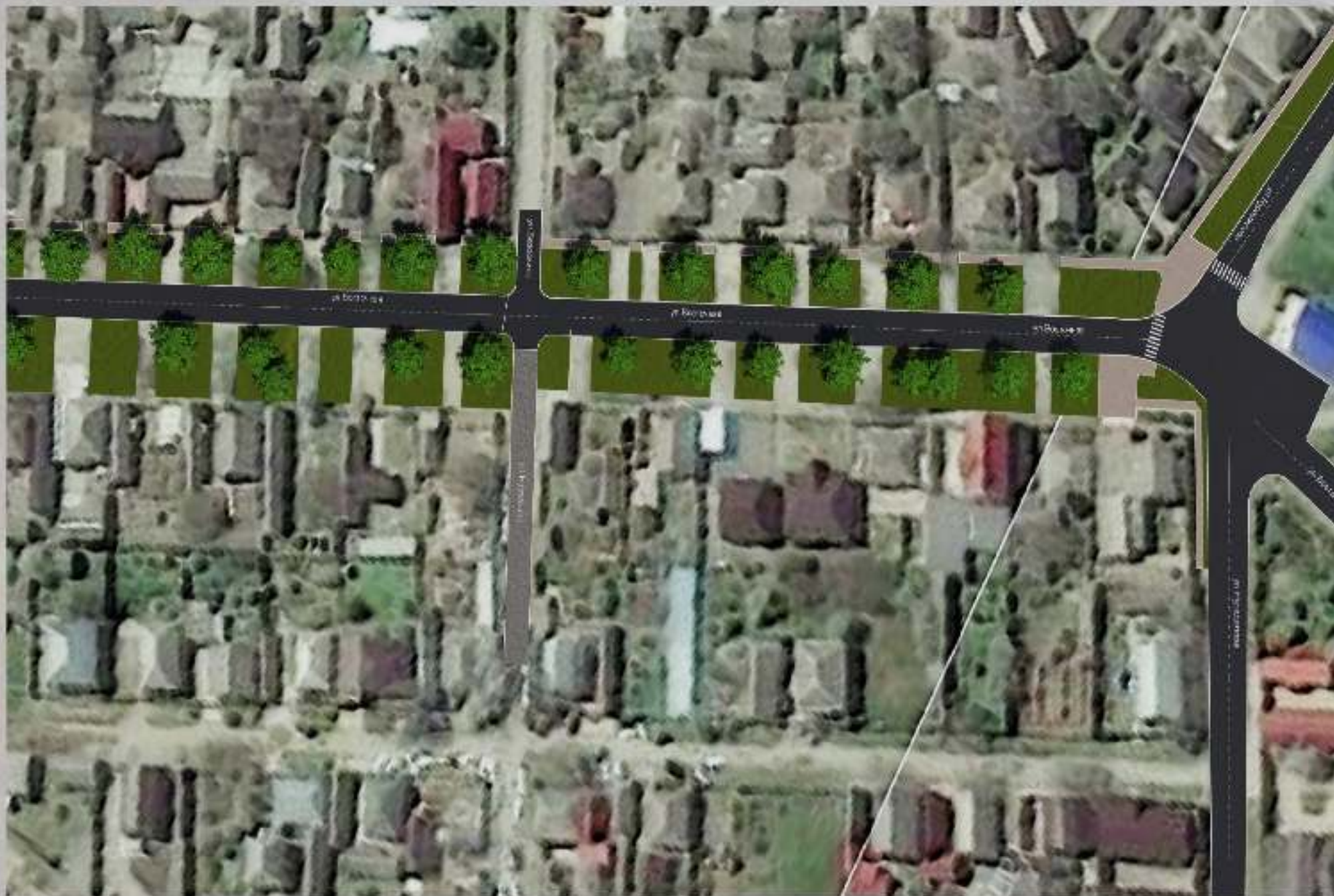
«Благоустройство общественной территории в г. Малгобек (ул. Восточная - от ул. Нурадилова до ул. Весенняя)»