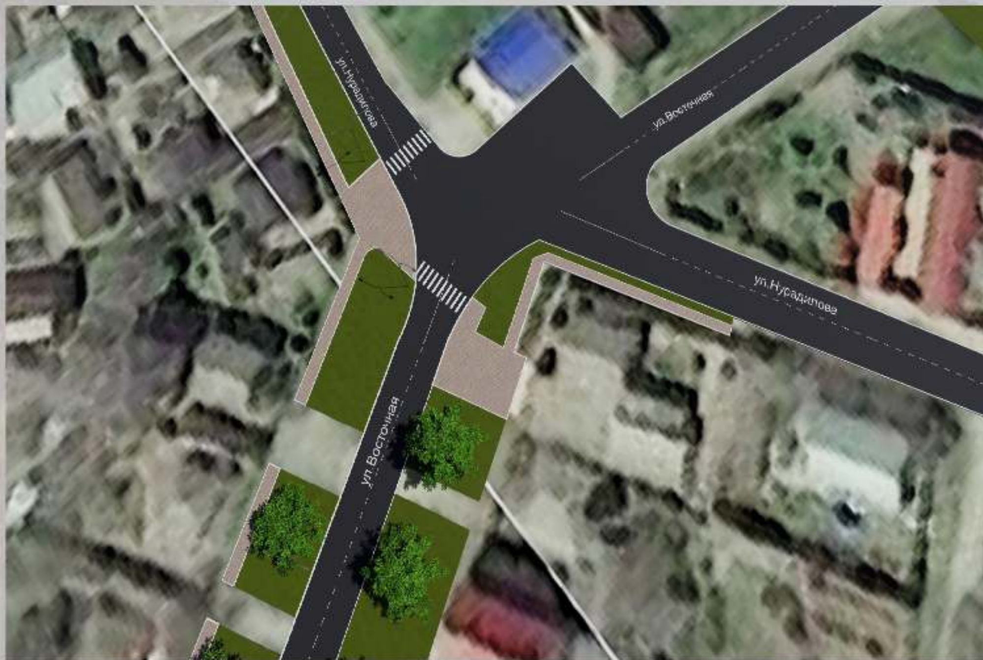
«Благоустройство общественной территории в г. Малгобек (ул. Восточная - от ул. Нурадилова до ул. Весенняя)»