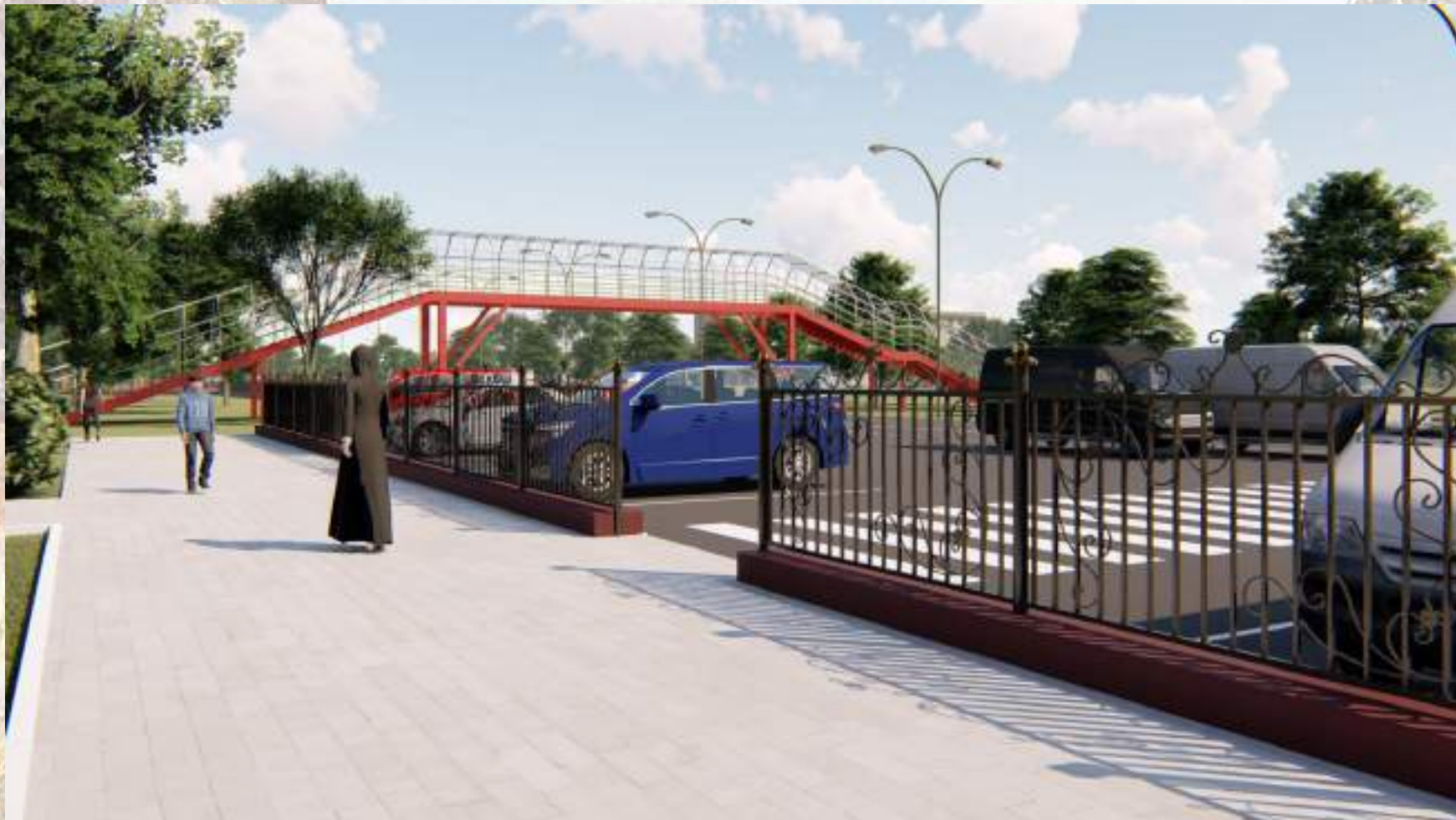
«Благоустройство общественной территории в г. Малгобек (участок улицы Осканова)»