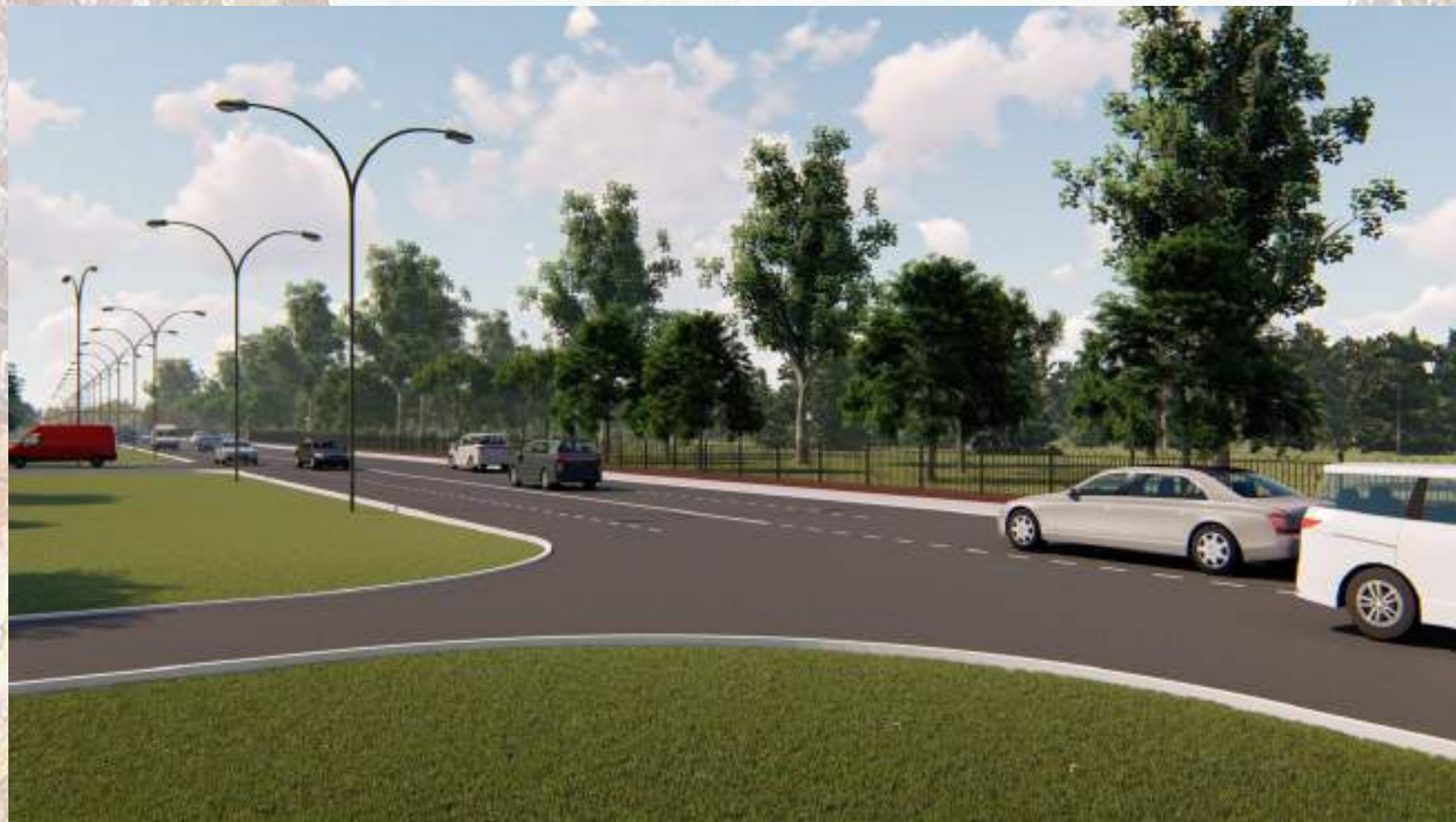
«Благоустройство общественной территории в г. Малгобек (участок улицы Осканова)»