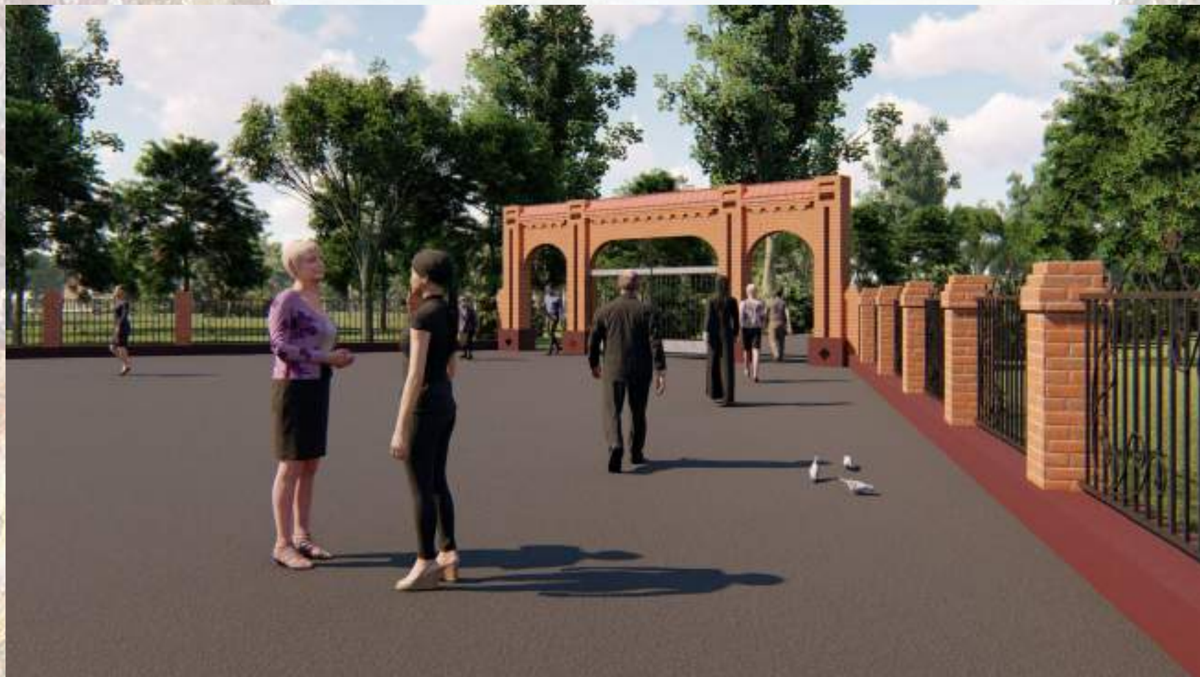
«Благоустройство общественной территории в г. Малгобек (участок улицы Осканова)»