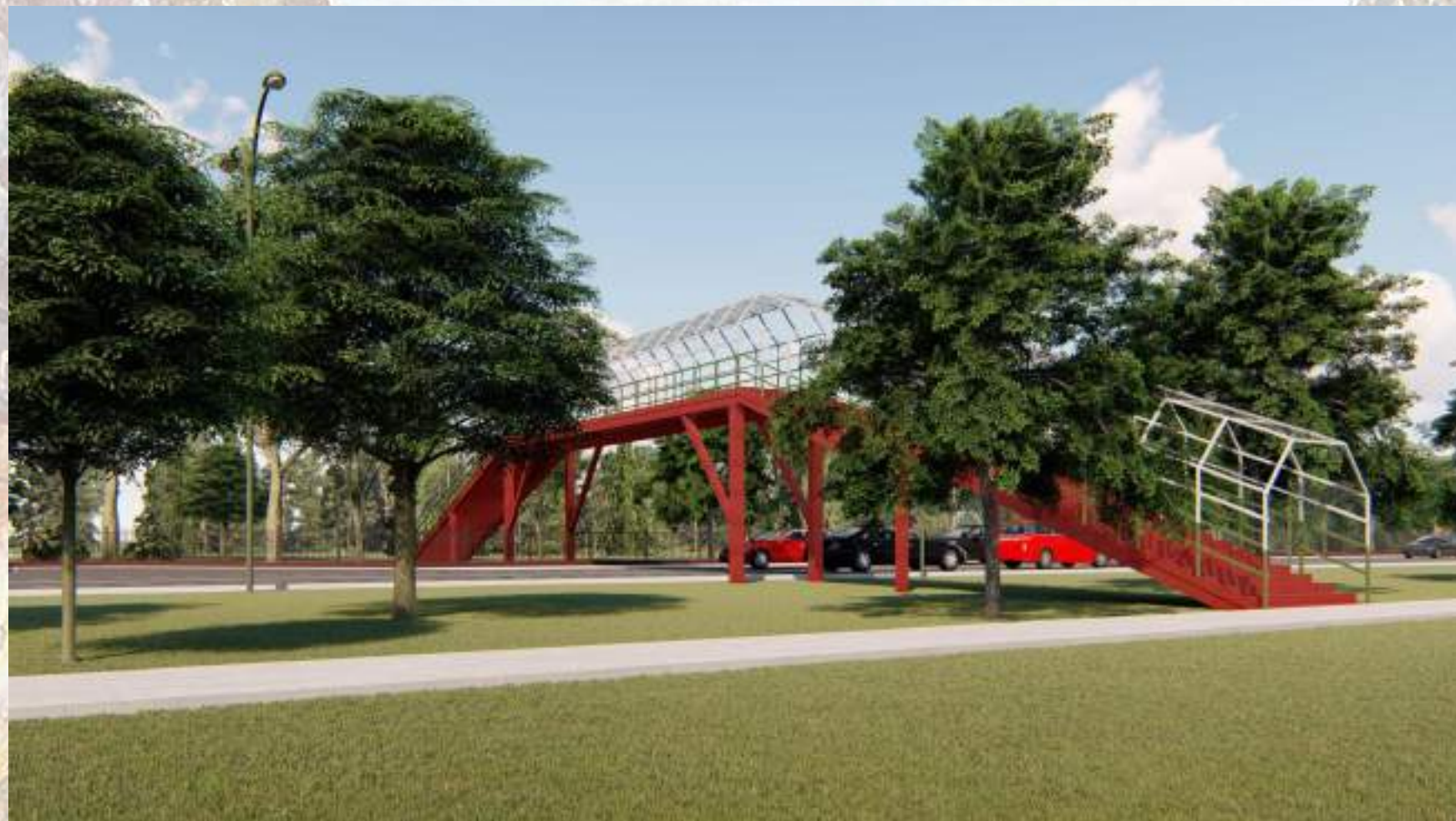
«Благоустройство общественной территории в г. Малгобек (участок улицы Осканова)»