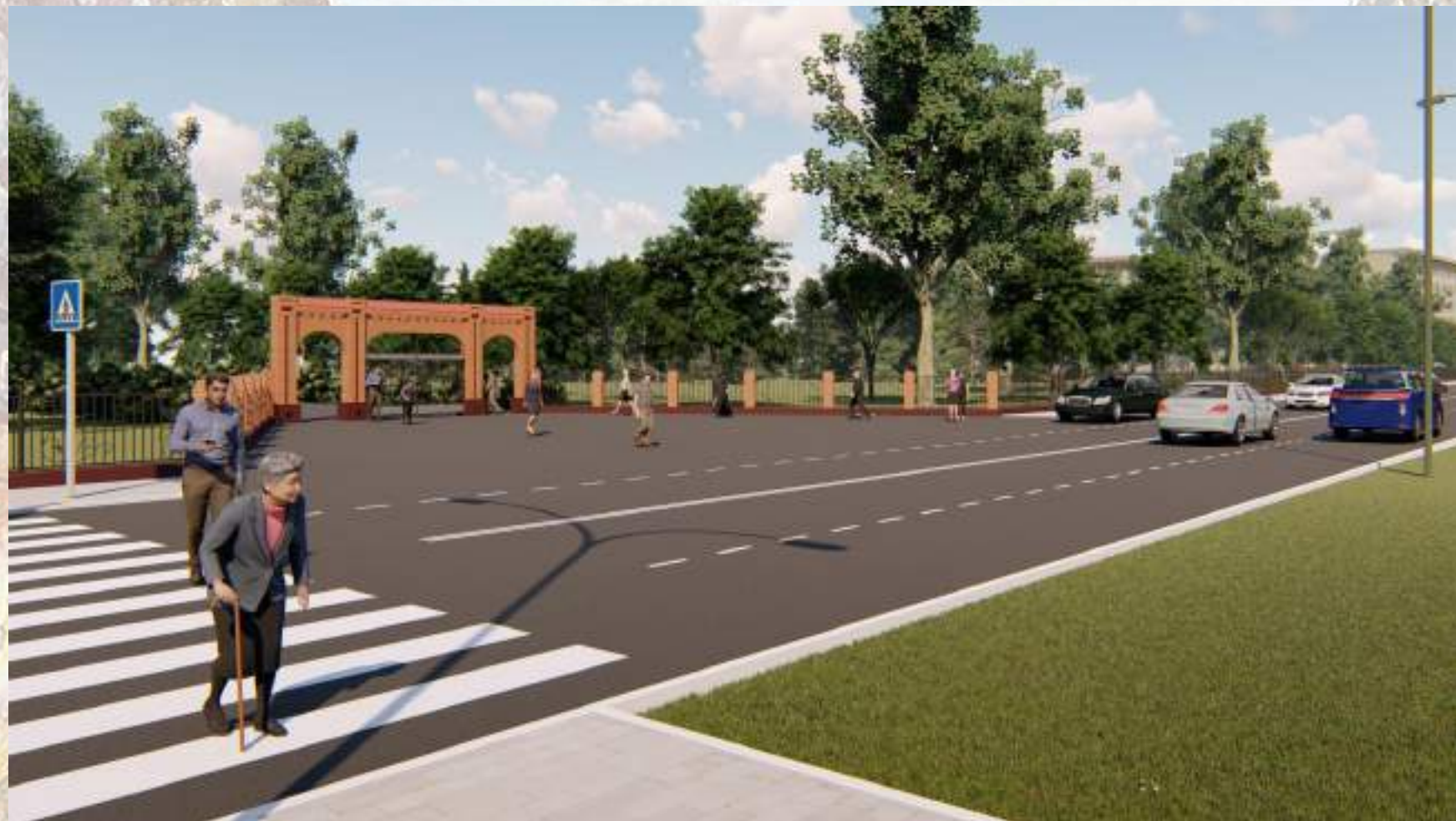
«Благоустройство общественной территории в г. Малгобек (участок улицы Осканова)»