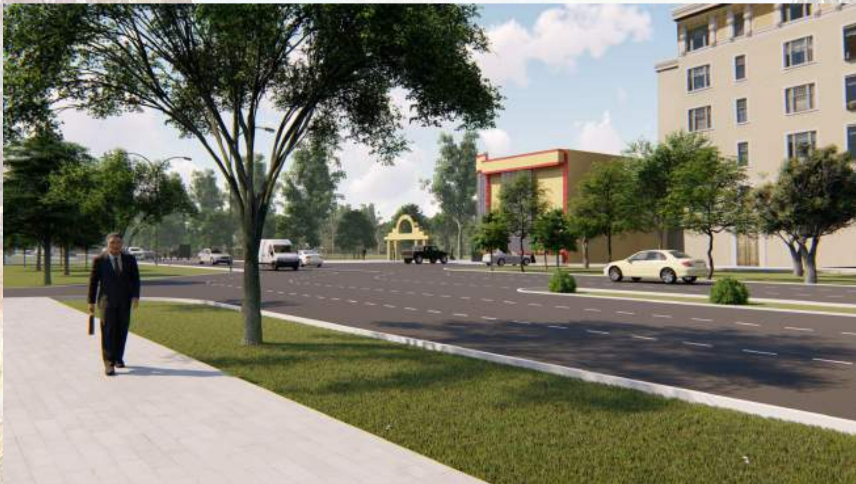
«Благоустройство общественной территории в г. Малгобек (участок улицы Осканова)»