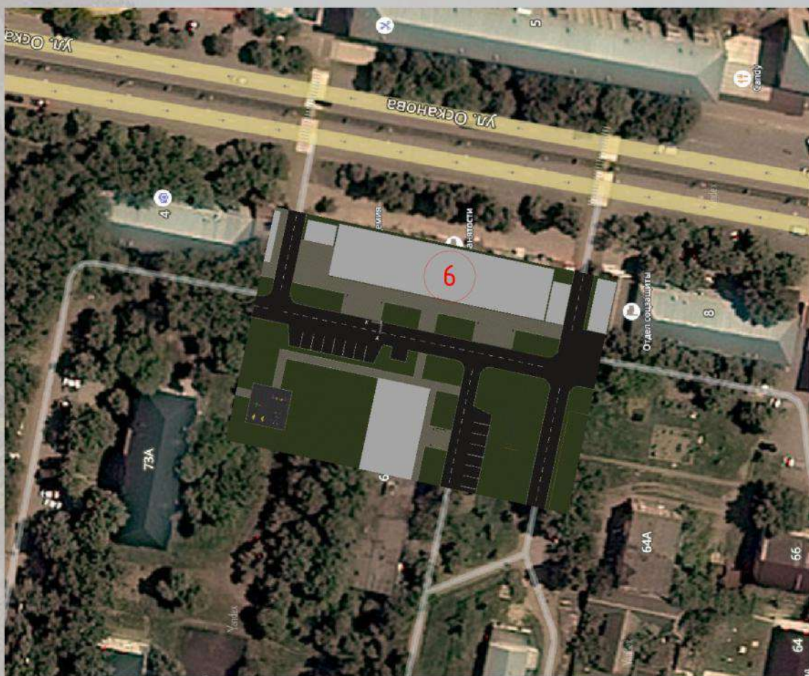
«Благоустройство общественной территории в г. Малгобек (дворовая часть дома №6 по ул. Осканова)»