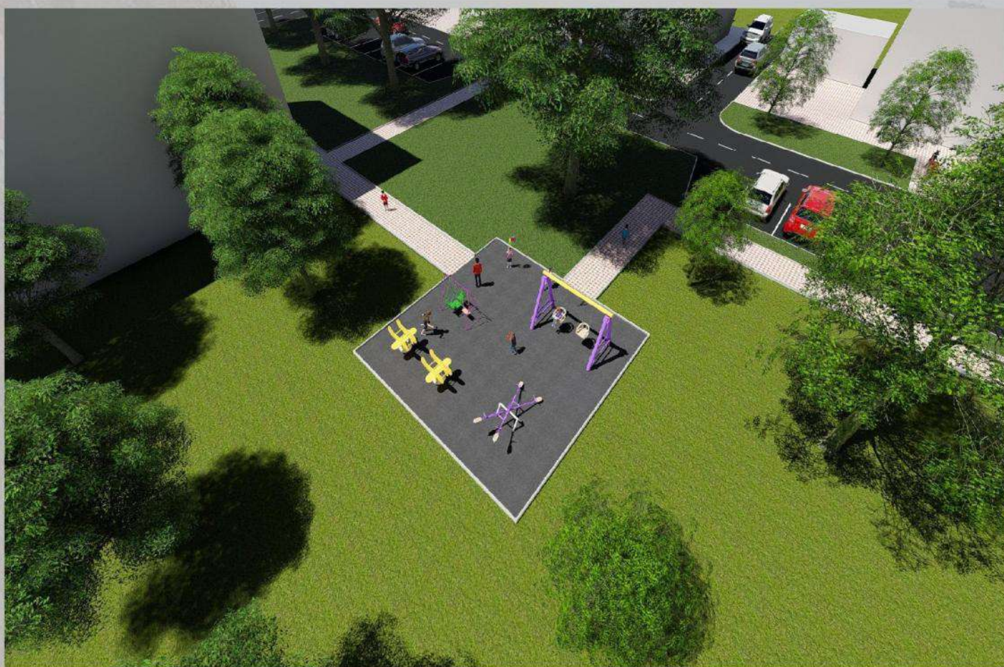
«Благоустройство общественной территории в г. Малгобек (дворовая часть дома №6 по ул. Осканова)»