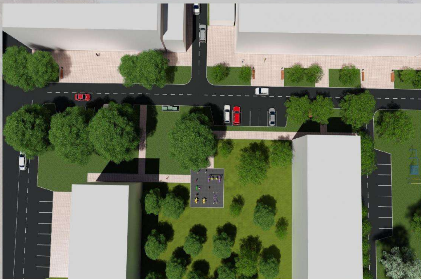
«Благоустройство общественной территории в г. Малгобек (дворовая часть дома №6 по ул. Осканова)»