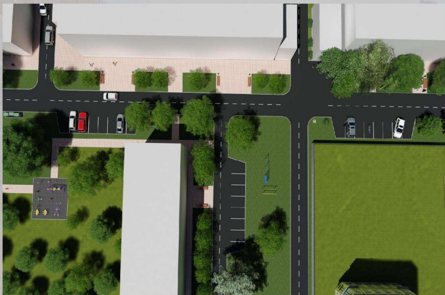
«Благоустройство общественной территории в г. Малгобек (дворовая часть дома №6 по ул. Осканова) »