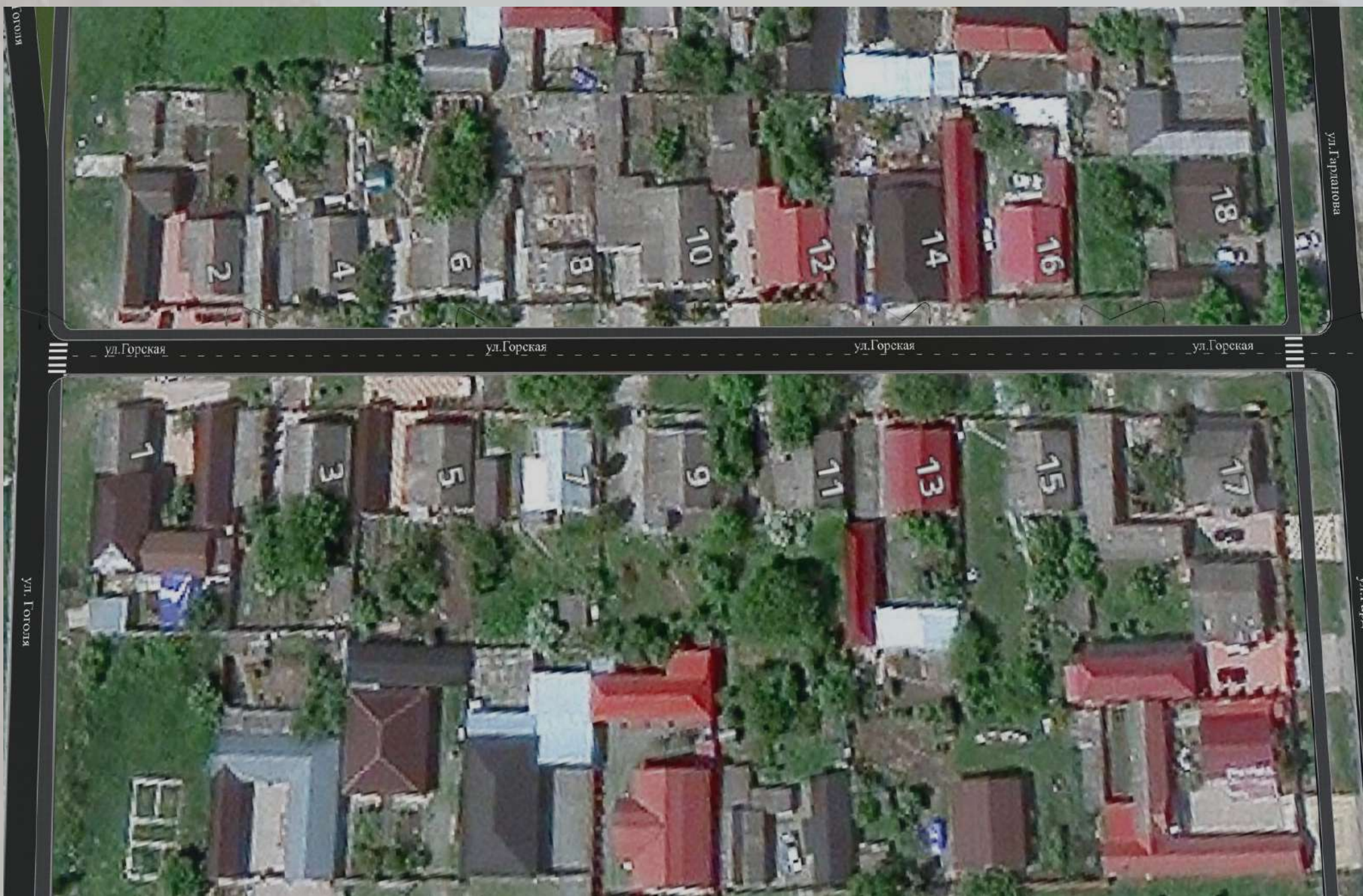
«Благоустройство общественной территории в г. Малгобек (ул.Горская - от ул. Гарданова до ул. Гоголя)»