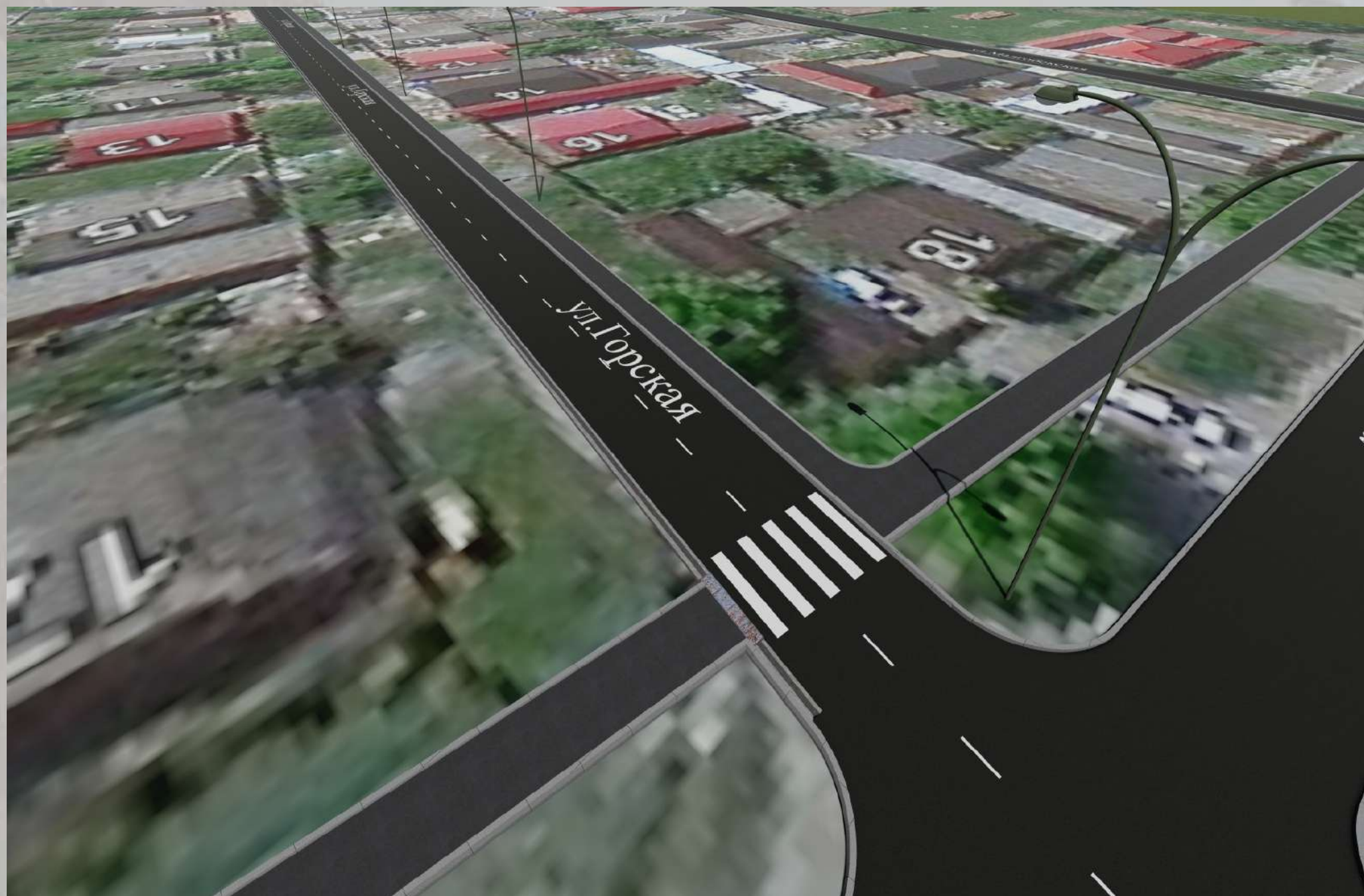
«Благоустройство общественной территории в г. Малгобек (ул.Горская - от ул. Гарданова до ул. Гоголя)»