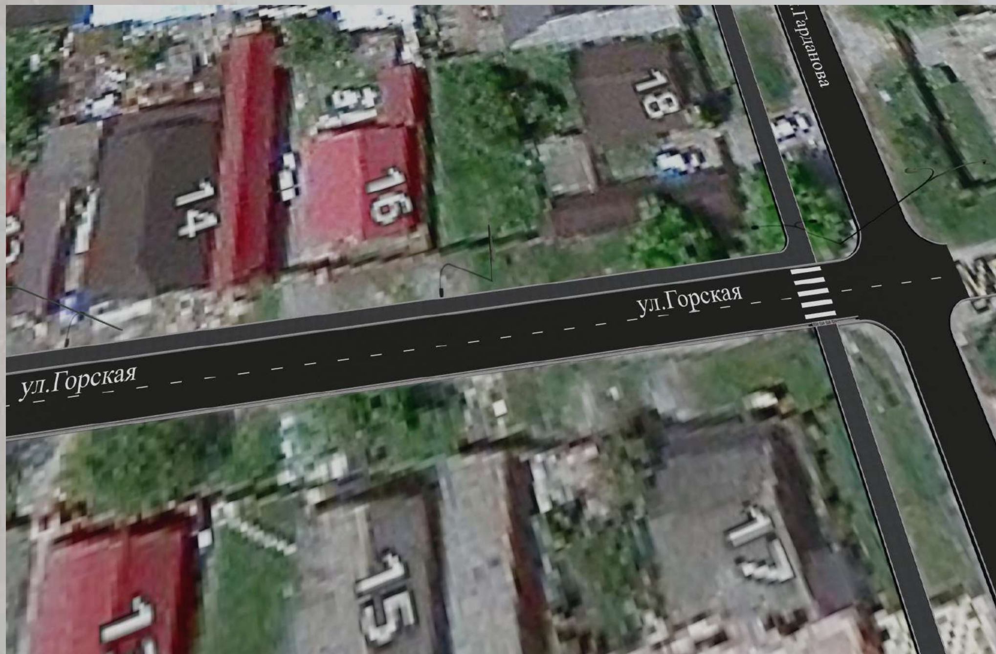
«Благоустройство общественной территории в г. Малгобек (ул.Горская - от ул. Гарданова до ул. Гоголя)»