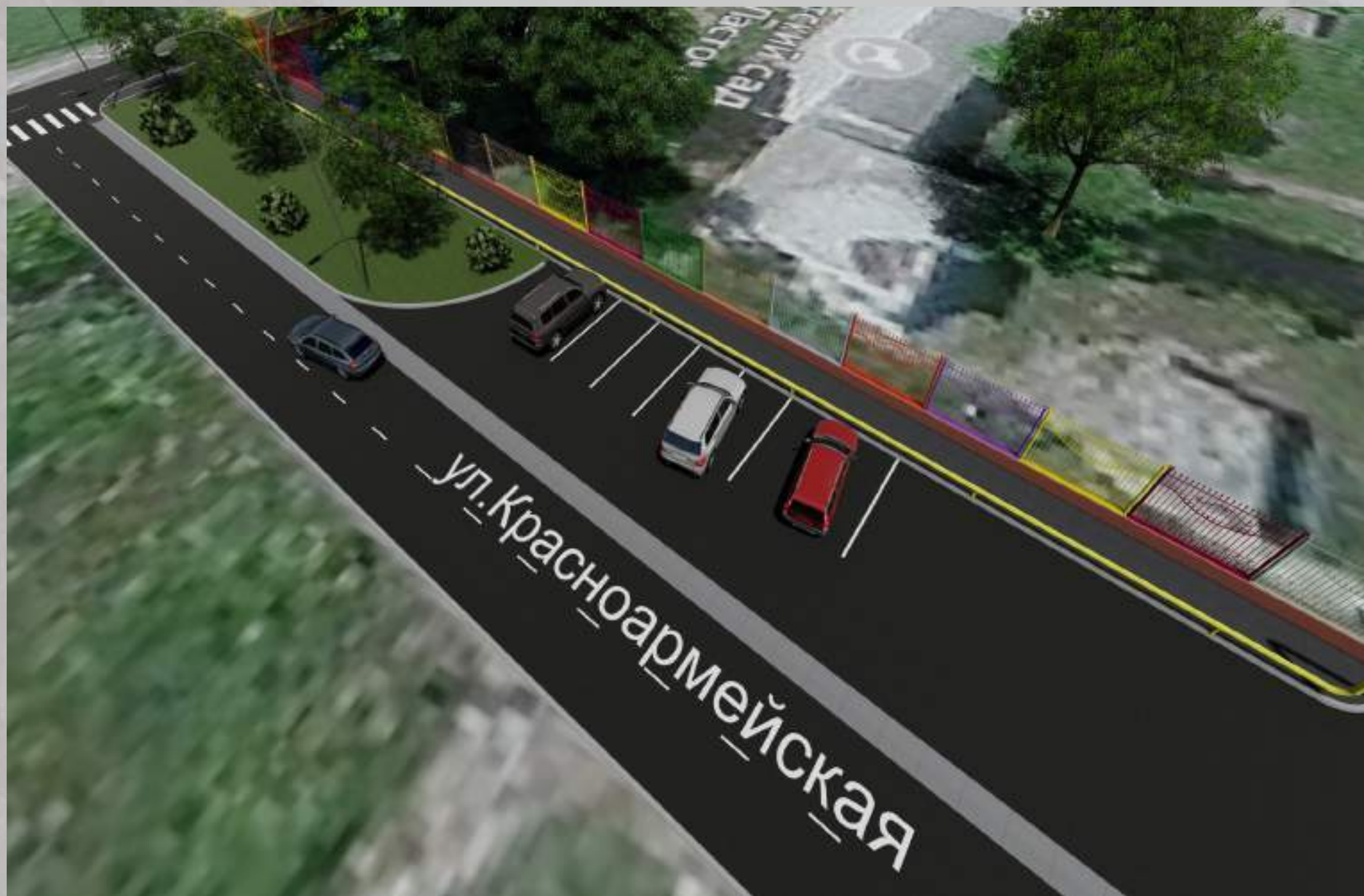
«Благоустройство общественной территории в г. Малгобек (ул. Красноармейская - от ул. Базоркина до ул. Гарданова)»