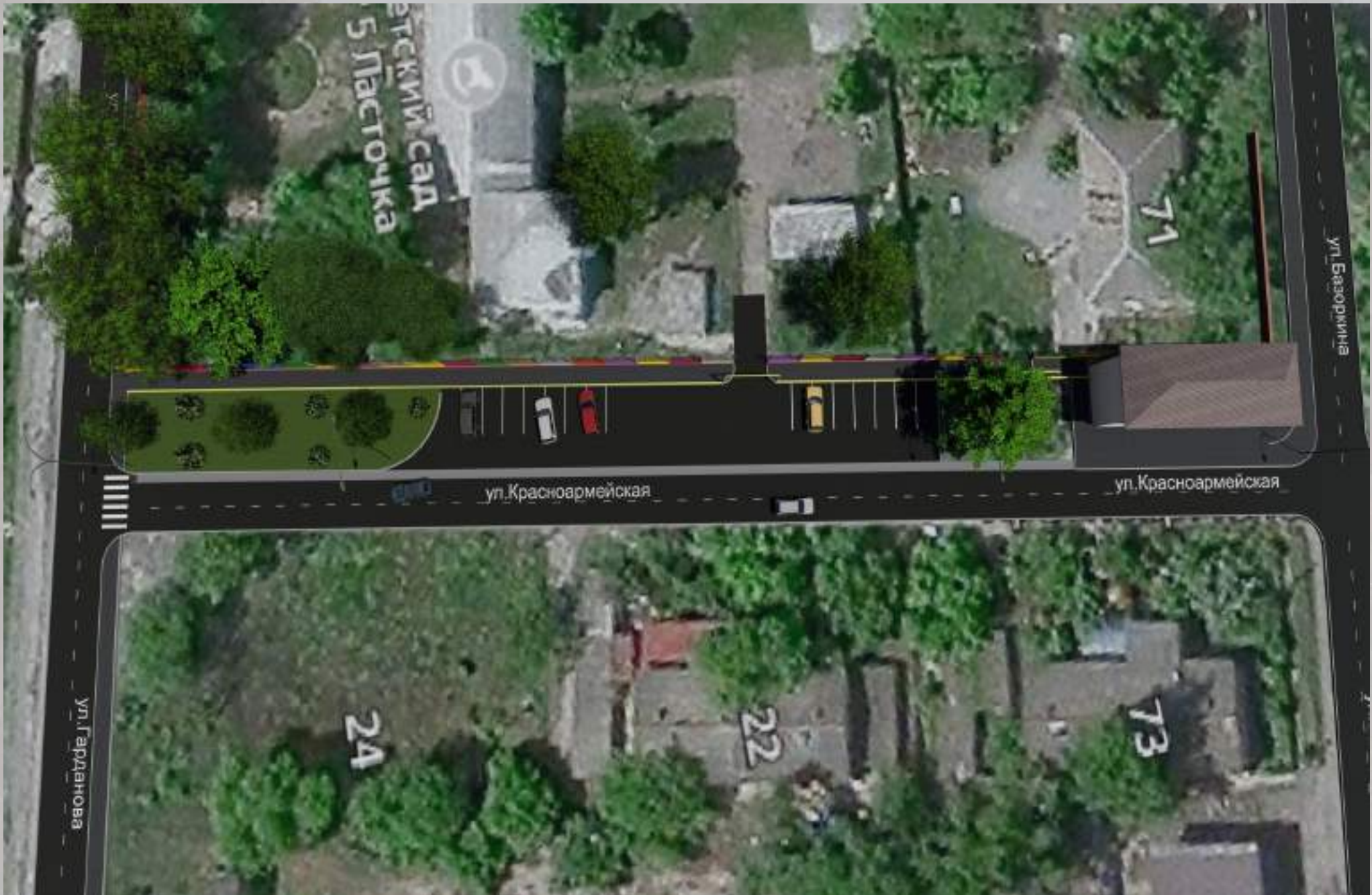
«Благоустройство общественной территории в г. Малгобек (ул. Красноармейская - от ул. Базоркина до ул. Гарданова)»