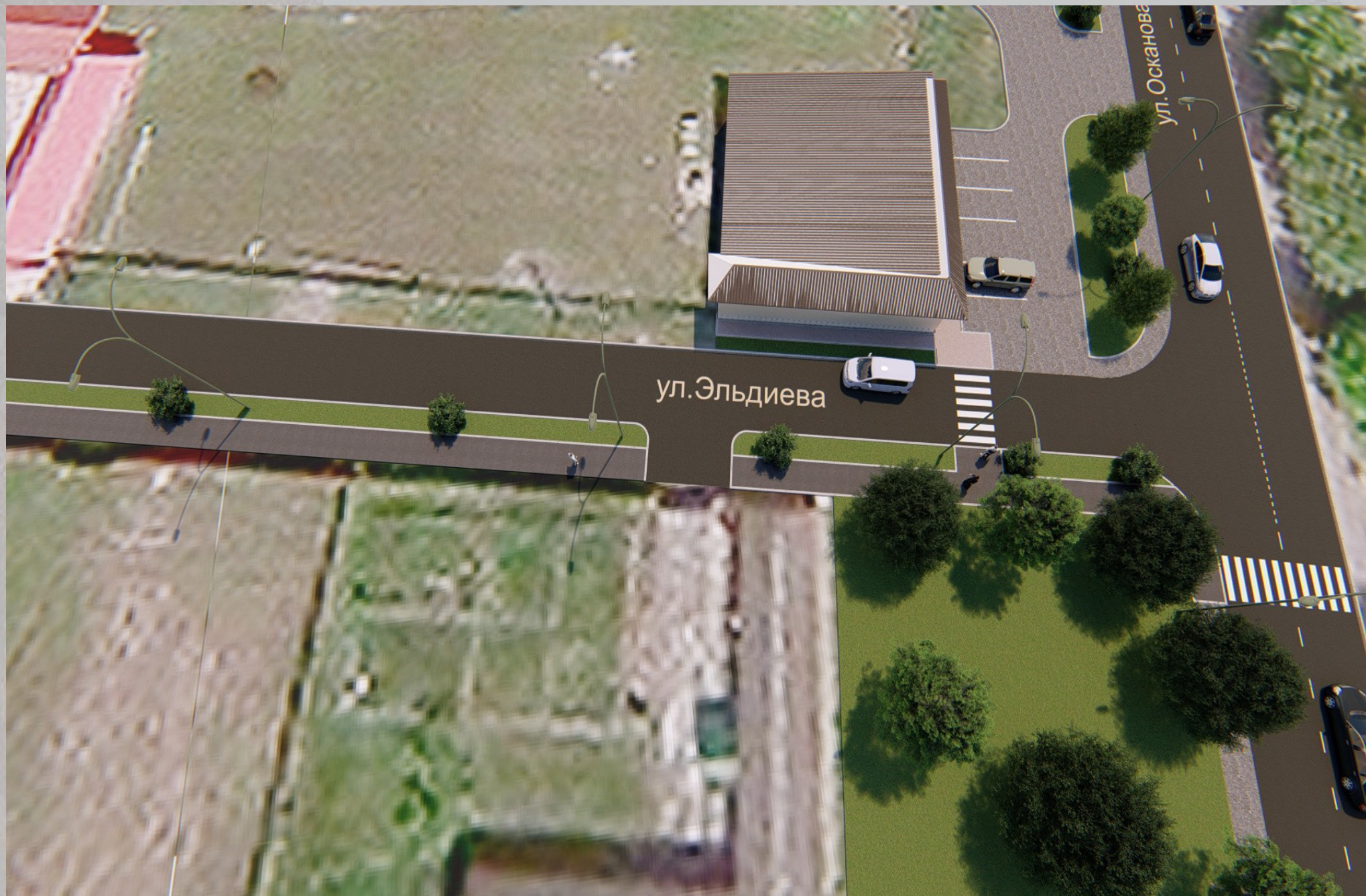
«Благоустройство общественной территории в г. Малгобек, ул. Эльдиева»