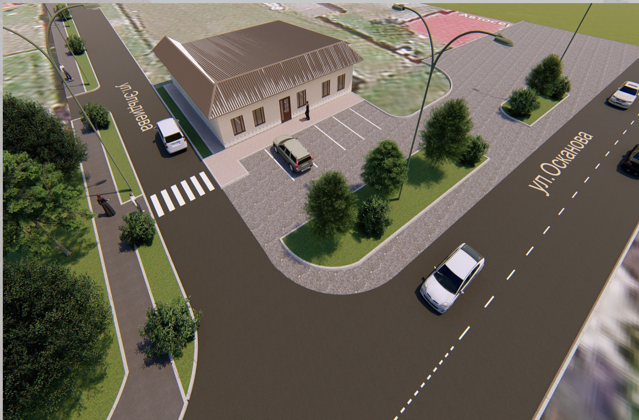
«Благоустройство общественной территории в г. Малгобек, ул. Эльдиева»