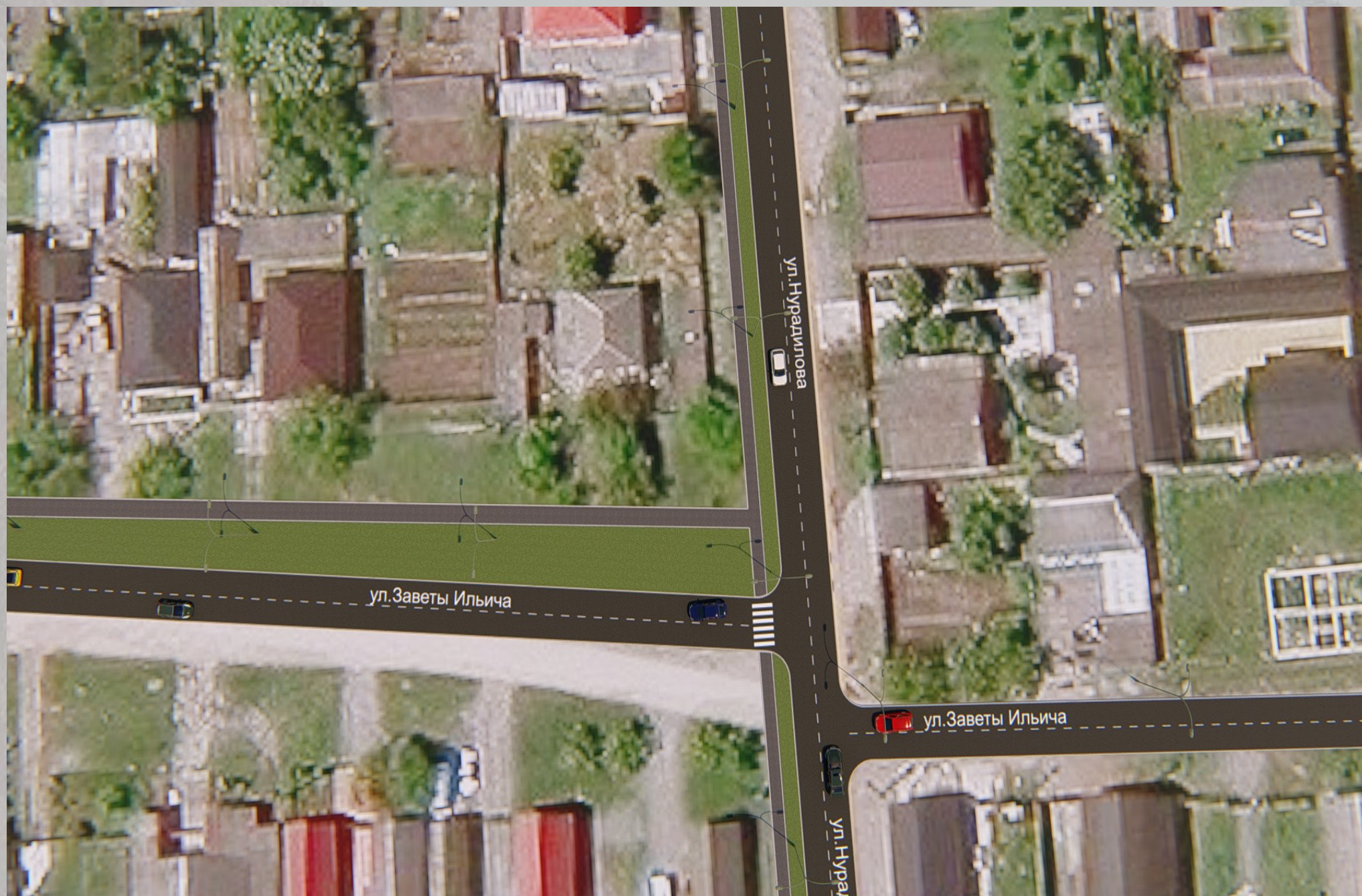
«Благоустройство общественной территории в г. Малгобек, ул. Заветы Ильича»