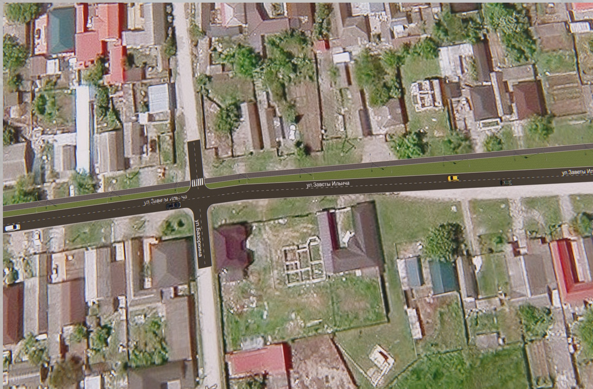
«Благоустройство общественной территории в г. Малгобек, ул. Заветы Ильича»