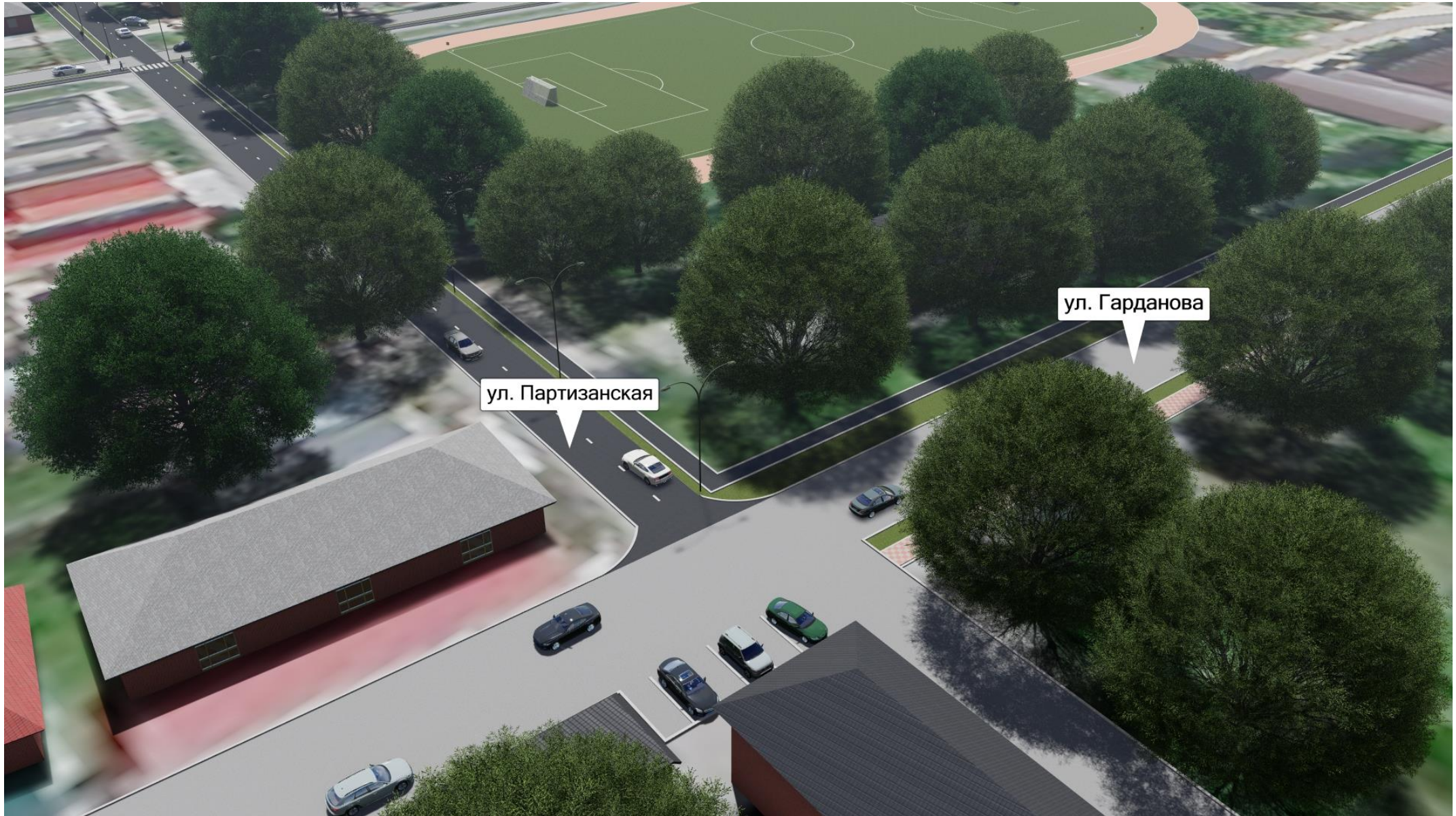
«Благоустройство ул. Партизанская»