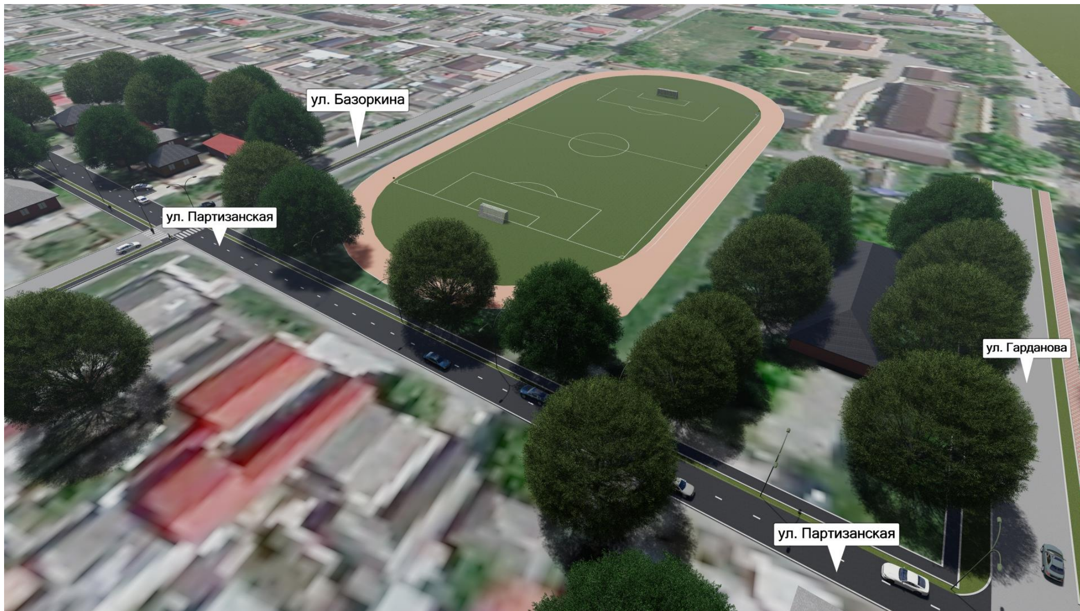
«Благоустройство ул. Партизанская»